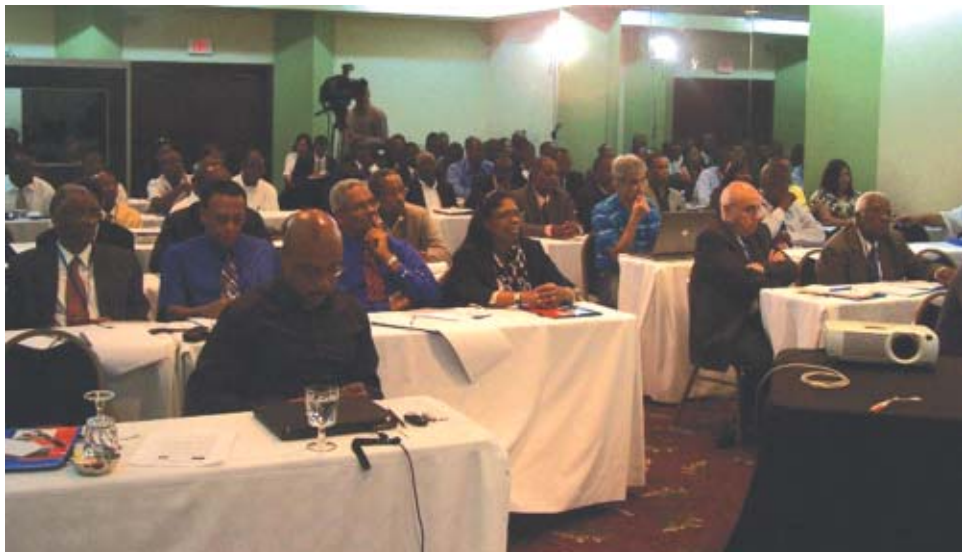
L'assistance à la conférence tenue le week-end dernier à Santo Domingo sous le patronage de la « Ligue des Pasteurs Haïtiens en République Dominicaine »