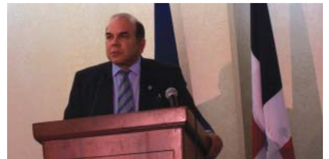
Intervenant à la conférence de Santo Domingo, le député de la droite nationaliste dominicaine Pellegrin Castillo