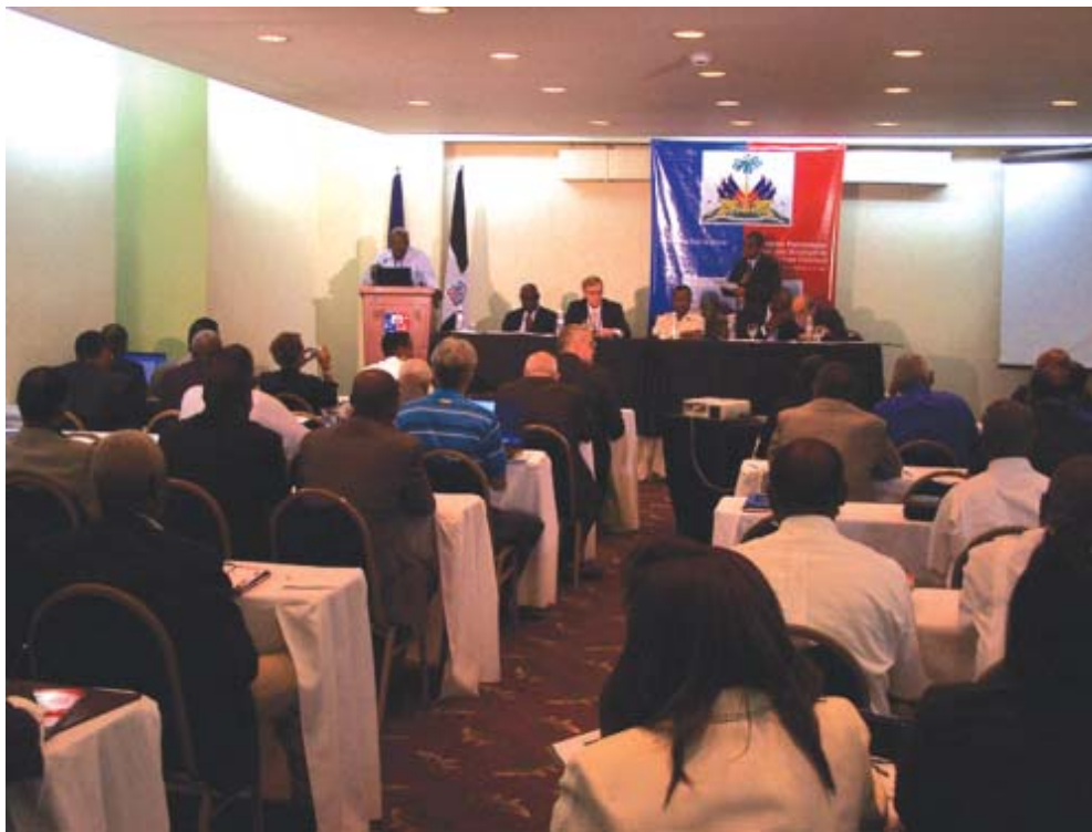
Au nombre de près de 50 personnes, participants, invités et journalistes à la conférence sur Haïti qui s'est tenue le week-end dernier à Santo-Domingo

des ingénieurs, des avocats, des entrepreneurs, une grande concentration de la société civile haïtienne « dont on ne saurait ignorer l'importance dans l'évolution politique du pays », puisqu'elle est déjà impliquée dans son évolution économique.